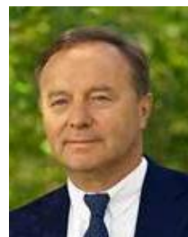
Jean-Michel FOURGOUS Maire d'Elancourt Président de SQY