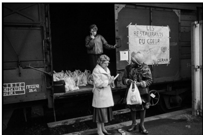
Des bénévoles des Restos du Cœur distribuent des sacs de nourriture depuis un wagon de la SNCF à Cannes, le 29 décembre 1985.

Après Paris, l'exposition se tiendra dans plusieurs autres grandes villes de France, chacune importante dans l'histoire des Restos du Cœur.